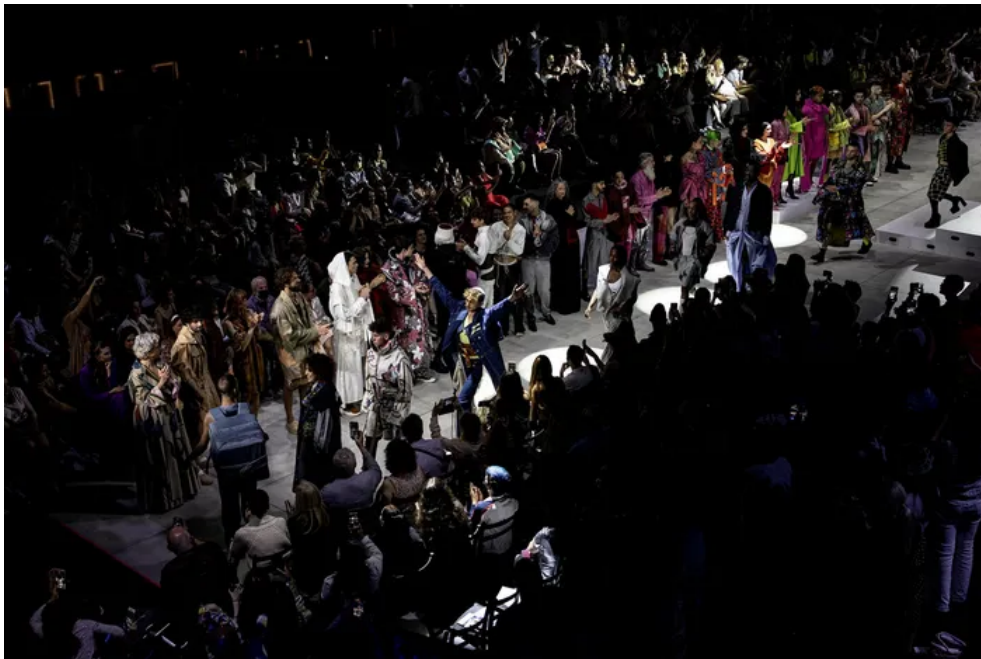
שבוע האופנה בתל אביב. להעדיף מעצבים מקומיים

מעט לאחר השבת הארוכה, צרכניות אופנה החלו לקרוא להחרים את שיין עקב תמיכה לכאורה בצד הפלסטיני במלחמה: מה שהחל במכירת דגלי פלסטין (כשדגלי ישראל לא נמצאו באתר), המשיך להחלטת האתר לבטל שילוח חינם לישראל ולהשעות קמפיינים של משפיעניות ישראליות, והגיע לכך שלקוחות דיווחו על קבלת חבילות עם מסקנטייפ בצבעי אדום וירוק – שהזכיר להם באופן חשוד את צבעי דגל פלסטין. שיין תלתה את האשמה ב"אתגרים לוגיסטיים" וב"מלאי משתנה", וכל אחד מהדברים האלו בנפרד לא בהכרח מביע תמיכה בחמאס – אבל השילוב ביניהם, נוכח העיתוי, מייצר תמונה מחשידה.