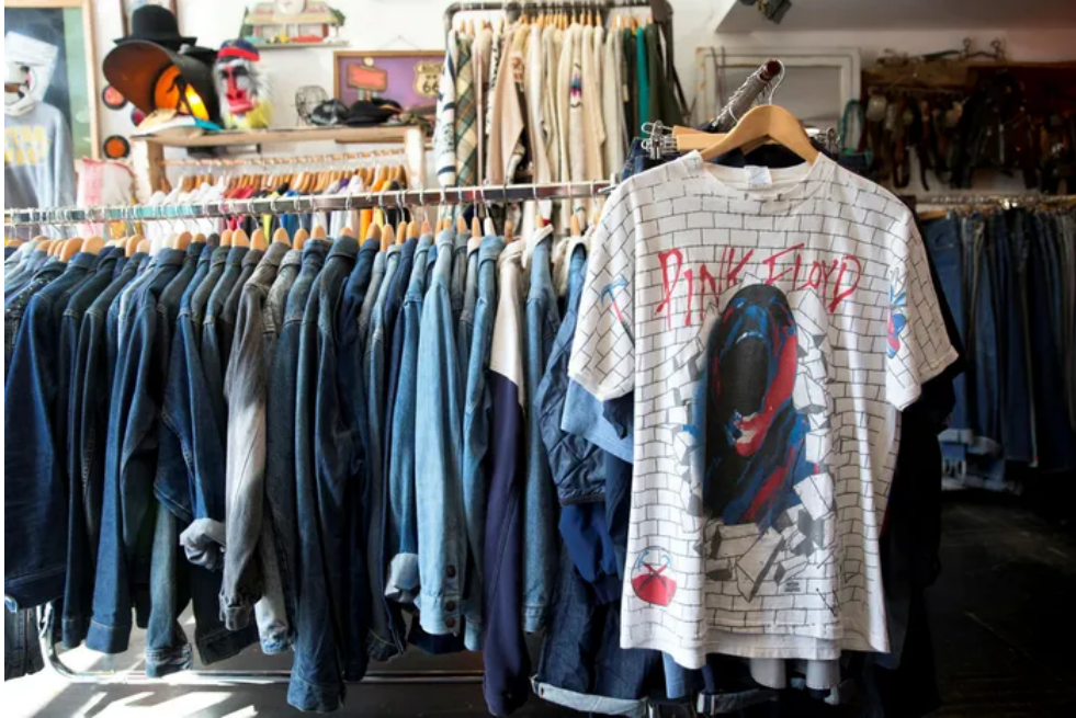
חנות בגדים יד שנייה בתל אביב

ובימים אלה, התשובה הזאת מרגישה נכונה במיוחד. תעשיית האופנה הישראלית בורכה במעצבים ובמעצבות עצמאים רבים שמייצגים את היצירתיות הישראלית, מקפידים על העסקה הוגנת ומייצרים קולקציות קטנות ומקיימות מטבען. נכון, קולקציות אלו יקרות יותר באופן משמעותי מרכישה בשיין – אבל אפשר לקנות אותן ולהישאר עם מצפון נקי.