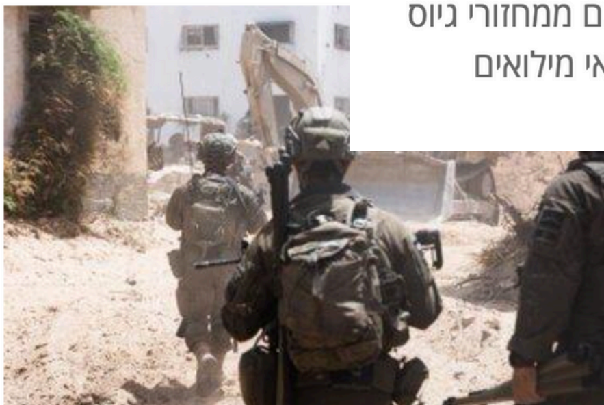
כוח צה"ל פועל בעזה