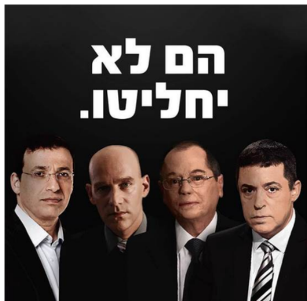
קמפיין שהתפרסם בבחירות 2019 כנגד עיתונאים