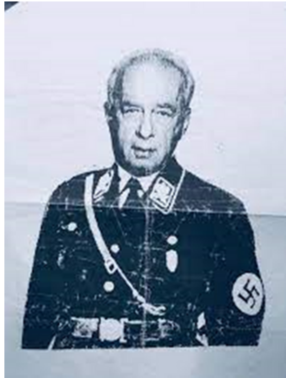
תמונה שהופצה בהפגנות נגד הסכמי אוסלו לפני רצח רבין - רבין במדי האס אס הנאצי