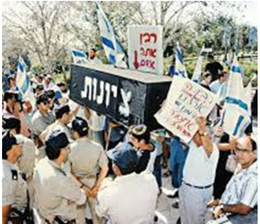
מחאה בנגד הסכמי אוסלו - ציונות בתוך ארון קבורה