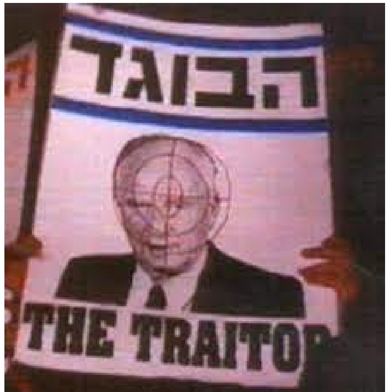
ברזה נגד רבין בתקופת הסכמי אוסלו