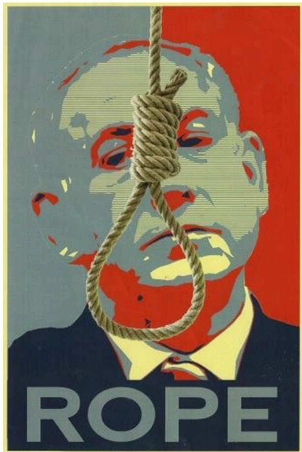
פוסטר שעוצב על ידי סטודנטית בבצלאל במסגרת תרגיל ונתלה בבצלאל מ- 2016