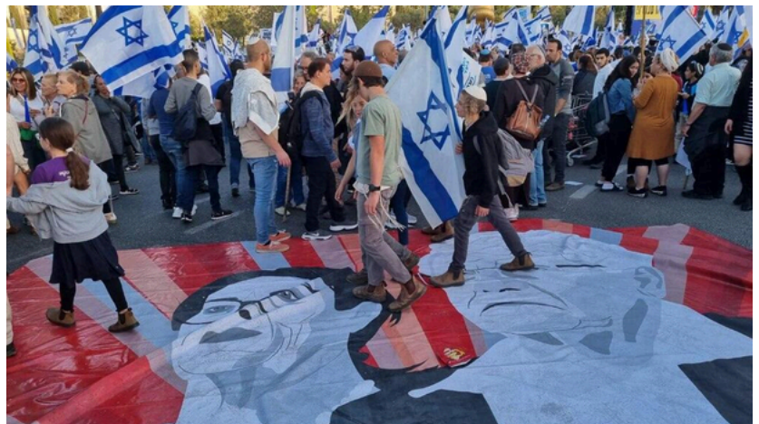
מפגינים דורכים על ציור של שופטי בית המשפט