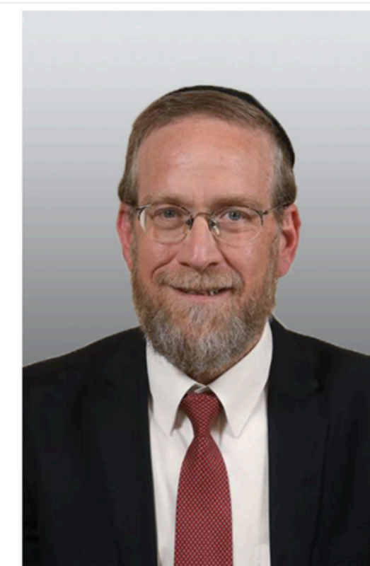
יצחק פינדרוס

יושב-ראש הוועדה המיוחדת לפניות הציבור ויושב-ראש סיעת יהדות התורה