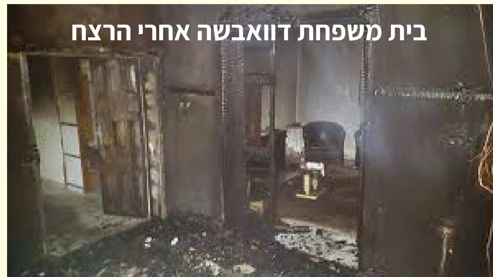
מאת Zakaria Sadah RHR - נוצר על-ידי מעלה היצירה, CC BY-SA 4.0,

https://commons.wikimedia.org/w/index.php?curid=115923767