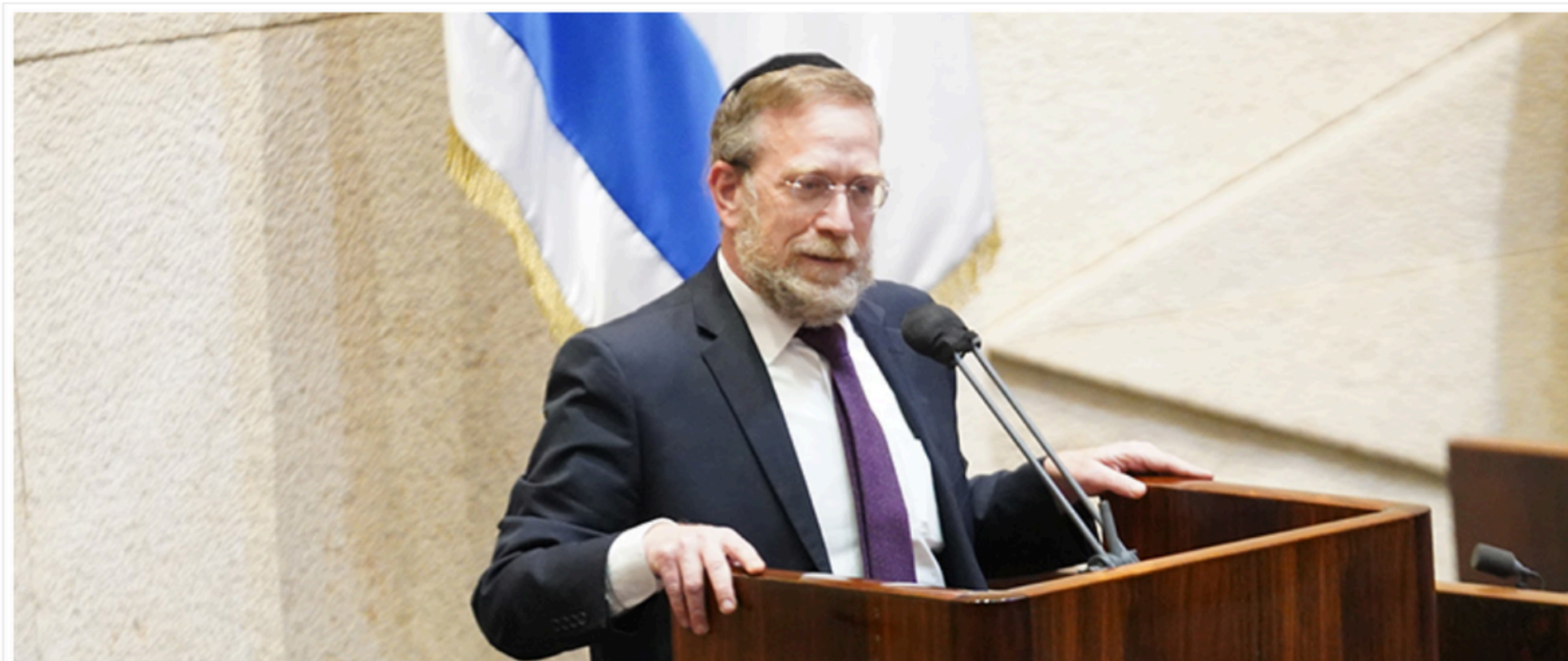
חבר הכנסת יצחק זאב פינדרוס

יושב-ראש הוועדה המיוחדת לפניות הציבור ויושב-ראש סיעת יהדות התורה