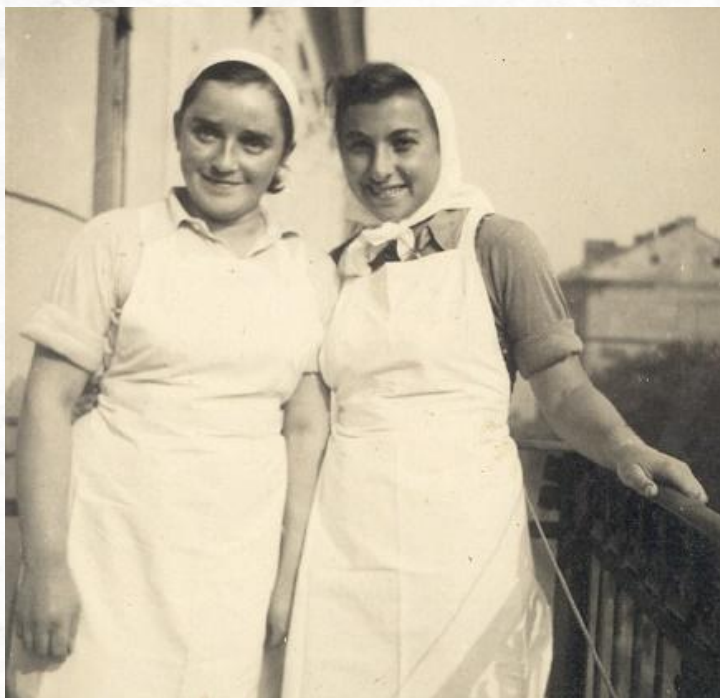
חניכות עובדות במטבח