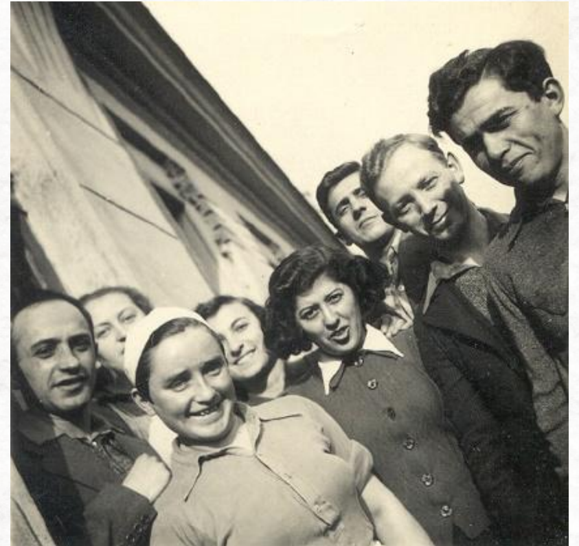
חברים בקומונה של תנועת "החלוץ" ברחוב דז'לנה 34 בוורשה

▪ למה דז'לנה הייתה "אי בודד"? מה החיים בה נתנו לחברי התנועה?